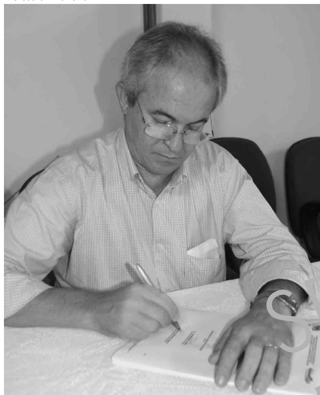
O Prefeito Adilton Sachetti decreta ponto facultativo nas repartições públicas