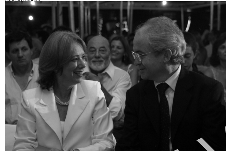
O Prefeito Adilton Sachetti prioriza ajuste financeiro na primeira semana de governo no dos servidores referente ao mês de dezembro de 2004.