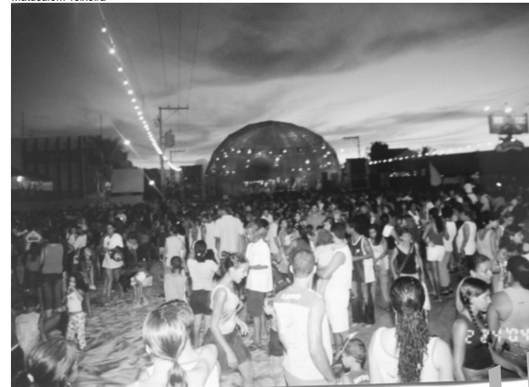
Vista geral do Rondonfolia 2004, o carnaval popular de Rondonópolis.