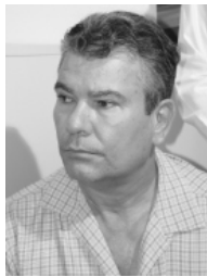
Ailton da Neves - Governo