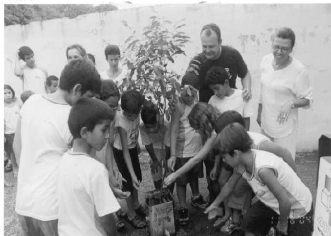
A Prefeitura doou 25 mudas de árvore para a escola estadual Adolfo Augusto de Moraes, na vila Aurora, realizando projeto de qualidade de vida.