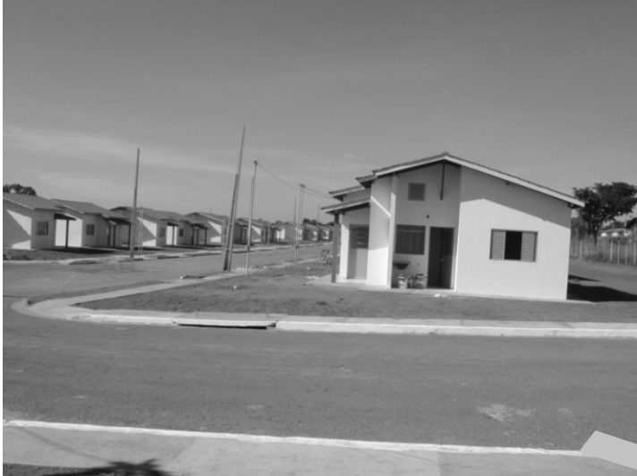
A Prefeitura de Rondonópolis oferece mais uma oportunidade para os interessados em realizar o sonho da casa própria

Os interessados em ter a casa própria, têm mais uma oportunidade de concretizar o sonho da moradia. A partir da próxima quarta-feira (13.10), a Prefeitura de Rondonópolis abre inscrições para a 3ª etapa do Programa de Arrendamento Residencial (PAR) para viabilizará mais 340 unidades habitacionais no município.