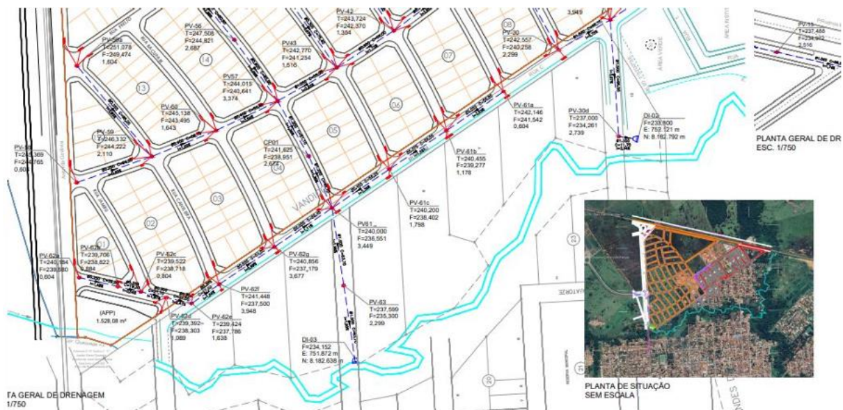
Imagem 01: Projeto atual.