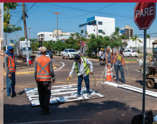
SINALIZAÇÃO HORIZONTAL E VERTICAL