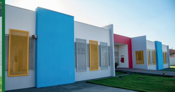
CONSTRUÇÃO CMEI MARIA AMÉLIA DE ARAÚJO - JD. IPIRANGA