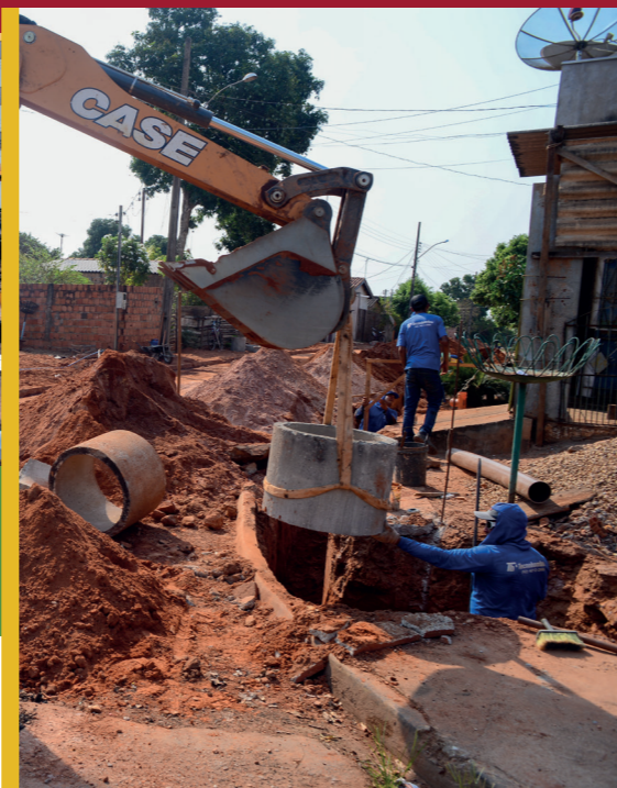
100% DE REDE DE ESGOTO, ÁGUA TRATADA E COLETA SELETIVA