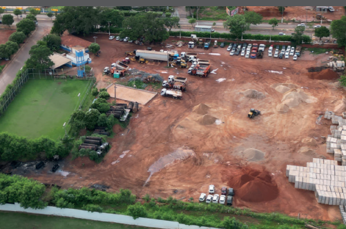
FUTURA SEDE DA AUTARQUIA MUNICIPAL DE TRANSPORTE COLETIVO NA AV. BANDEIRANTES