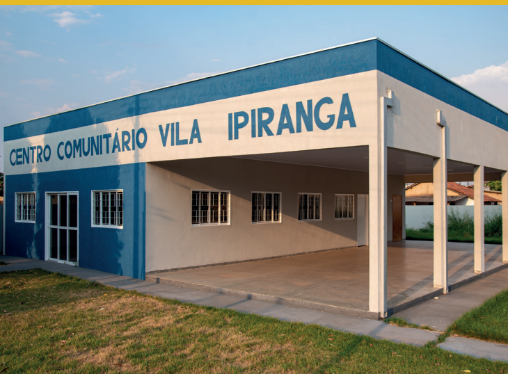
REFORMA DO CENTRO COMUNITÁRIO - JD. IPIRANGA