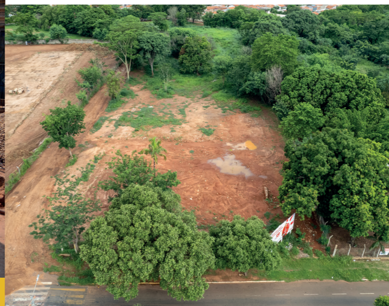
AQUISIÇÃO DE ÁREA PARA IMPLANTAÇÃO DO PARQUE DANDARA DOS PALMARES