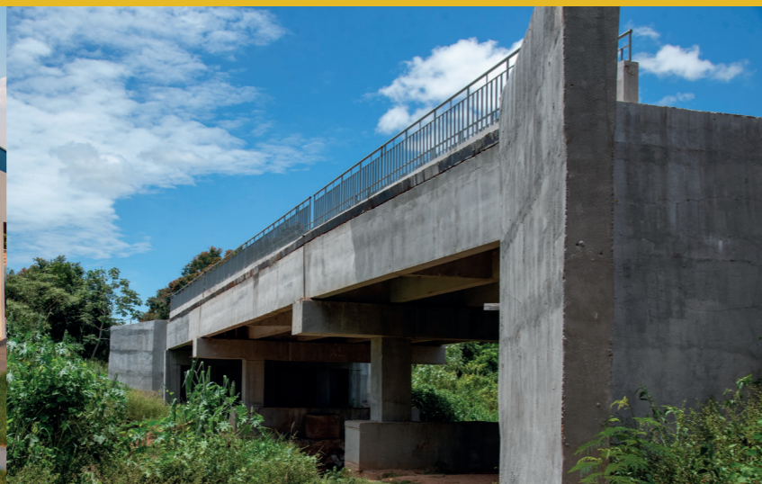
CONSTRUÇÃO DA PONTE DE CONCRETO NA RUA CORREDOR MUNICIPAL LIGANDO O JD. TAITI AO ANEL VIÁRIO