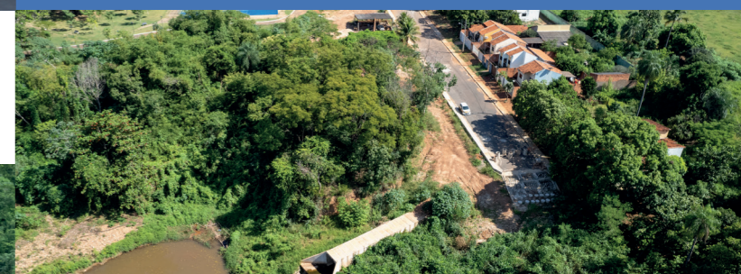
IMPLANTAÇÃO DE DRENAGEM PROFUNDA NO JARDIM PRIMAVERA SOLUCIONANDO PROBLEMA HISTÓRICO