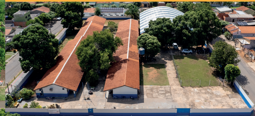
REFORMA DA ESCOLA MUNICIPAL ARÃO GOMES E CONSTRUÇÃO DA QUADRA COBERTA