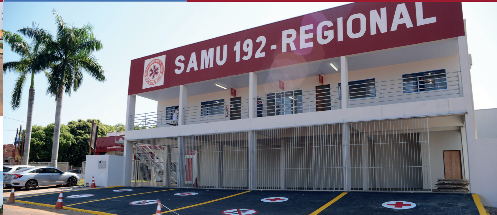
CONSTRUÇÃO DA BASE DO SAMU AO LADO DO CORPO DE BOMBEIROS

REFORMA DA UNIDADE BÁSICA DE SAÚDE - JD. IPIRANGA