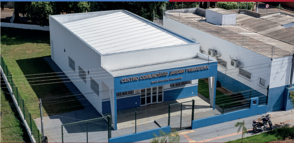
REFORMA DO CENTRO COMUNITÁRIO DO JARDIM PRIMAVERA