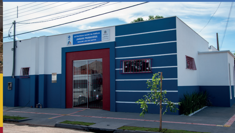
REFORMA DA UNIDADE DE SAÚDE DO JARDIM PRIMAVERA