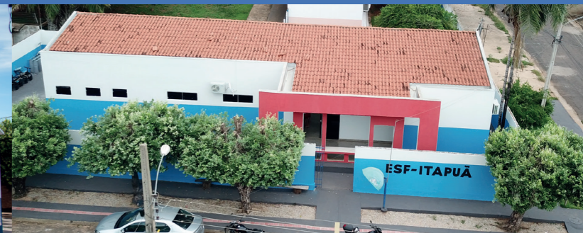
REFORMA DA UNIDADE BÁSICA DE SAÚDE DO JARDIM ITAPUÁ