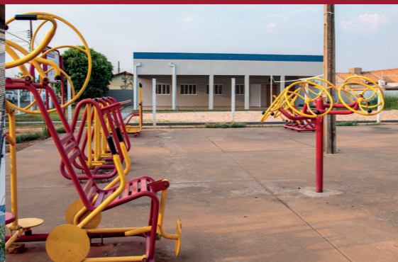
INSTALAÇÃO DE ACADEMIA POPULAR - JD IPIRANGA