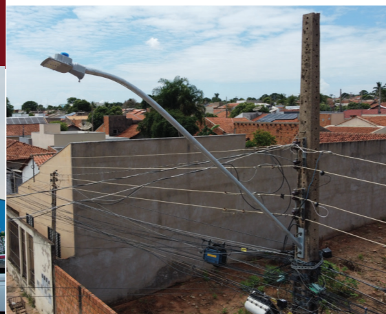
ILUMINAÇÃO DE LED NAS VIAS PÚBLICAS