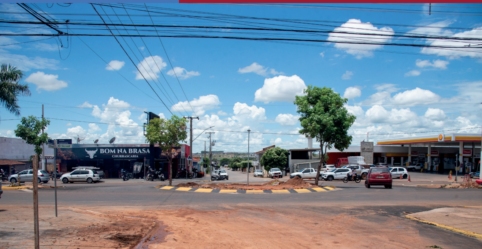
CONSTRUÇÃO DE ROTATÓRIA NA AV. BANDEIRANTES LIGANDO O JARDIM PRIMAVERA A VILA OPERÁRIA