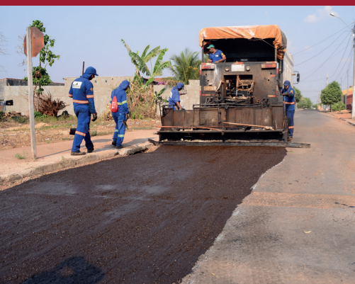
100% DE ASFALTO E APLICAÇÃO DE MICRORREVESTIMENTO EM TODA REGIÃO