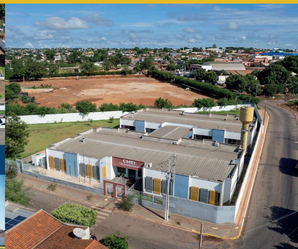
CONSTRUÇÃO CMEI PROF. ALESSANDRO GOMES DE JESUS - JD. DAS HORTÊNCIAS