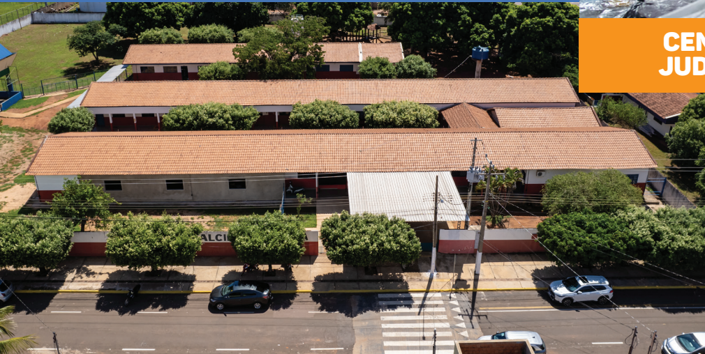
REFORMA E IMPLANTAÇÃO DE FAIXA ELEVADA NA ESCOLA ALCIDES PEREIRA DOS SANTOS