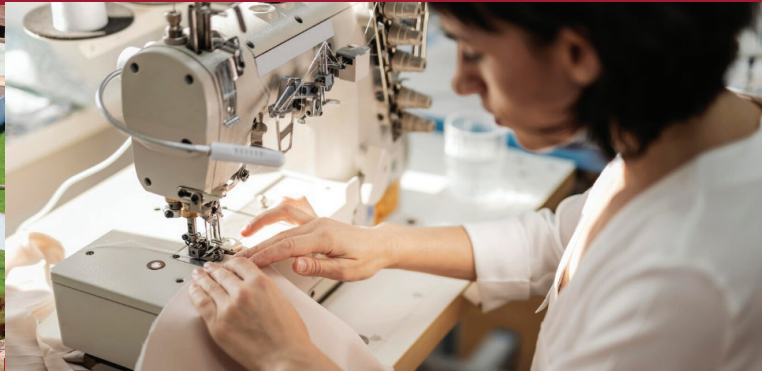
CURSOS DE QUALIFICAÇÃO PROFISSIONAL NA COMUNIDADE