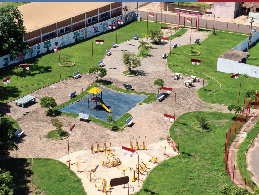
CONSTRUÇÃO DA PRAÇA KAZUO NINOMIYA