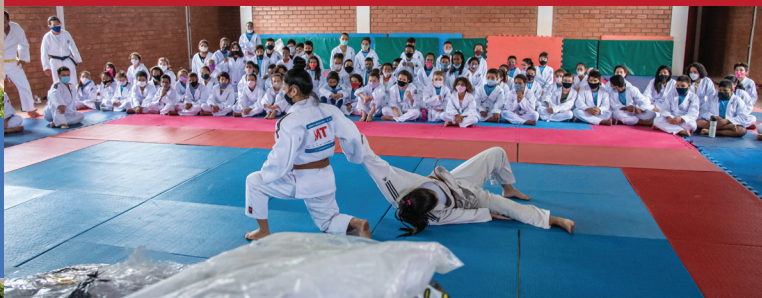
CENTRO DE TREINAMENTO DE JUDÔ PROF. MINORU ARIMOTO