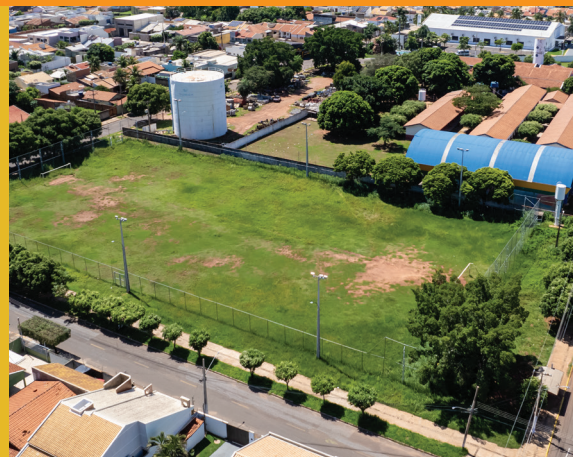
CONSTRUÇÃO DE CAMPO DE FUTEBOL E INTEGRAÇÃO À ESCOLA