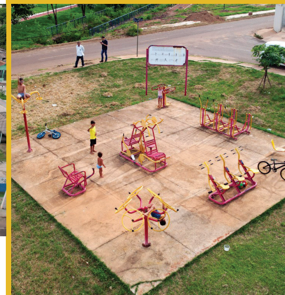
IMPLANTAÇÃO DE ACADEMIA POPULAR