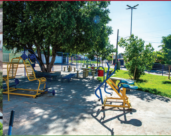
CONSTRUÇÃO DA PRAÇA OSVALDINA NOVAES