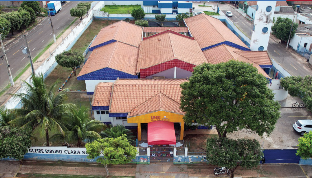
CONSTRUÇÃO E POSTERIOREMENTE REFORMA COM FAIXA ELEVADA DA CRECHE MÂRCIA GLEIBE RIBEIRO CLARA SOUTO