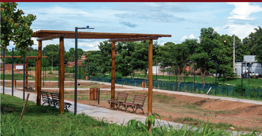
URBANIZAÇÃO AS MARGENS DO CÔRREGO QUEIXADA