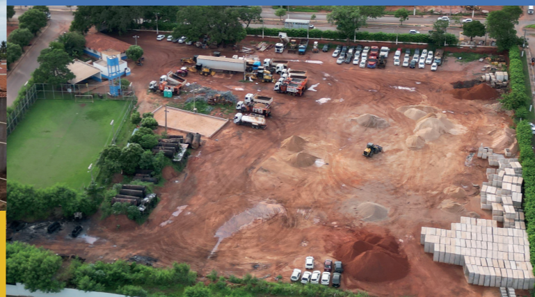
FUTURA SEDE DA AUTARQUIA MUNICIPAL DE TRANSPORTE COLETIVO SERÁ NA REGIÃO DA VILA OPERÁRIA