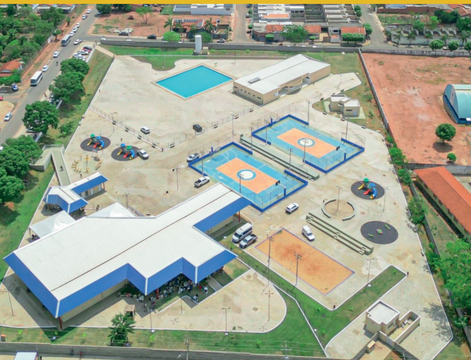
CONSTRUÇÃO DO SERVIÇO DE CONVIVÊNCIA E FORTALECIMENTO DE VÍNCULOS - PADRE LOTHAR