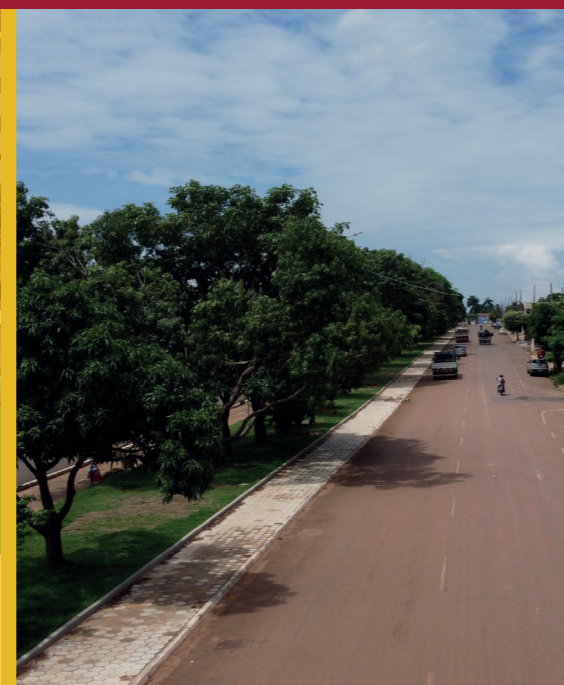
REVITALIZAÇÃO E REFORMA DA PISTA DE CAMINHADA DA AV. BANDEIRANTES