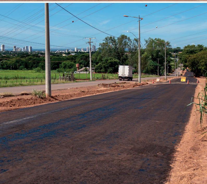
CONSTRUÇÃO DE PONTE DE CONCRETÓ E DUPLICAÇÃO DA AV. BANDEIRANTES ATÉ O ANEL VIÁRIO