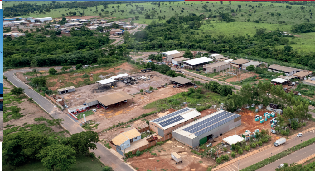
PAVIMENTAÇÃO E DRENAGEM EM 100% DO MICRO DISTRITO INDUSTRIAL ANÉZIO PEREIRA DE OLIVEIRA

VILA OPERÁRIA, VILA MARIANA E VILA ITAMARATY