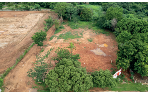
AQUISIÇÃO DE ÁREA PARA IMPLANTAÇÃO DO PARQUE DANDARA DOS PALMARES