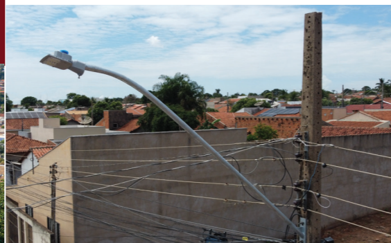
ILUMINAÇÃO DE LED EM TODAS AS COMUNIDADES DO DISTRITO