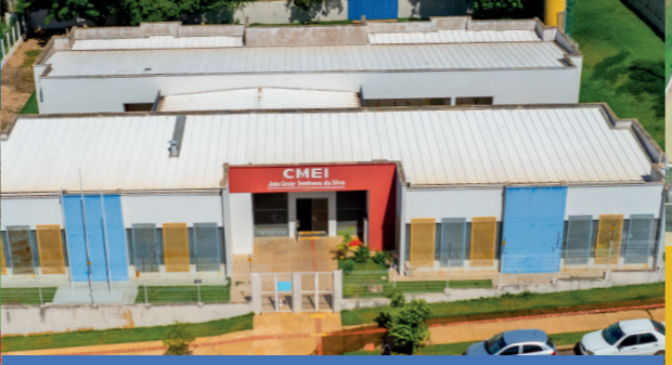
CONSTRUÇÃO DA CMEI JOÃO CÉSAR DOMINGOS DA SILVA - JD. LUZ D'YARA