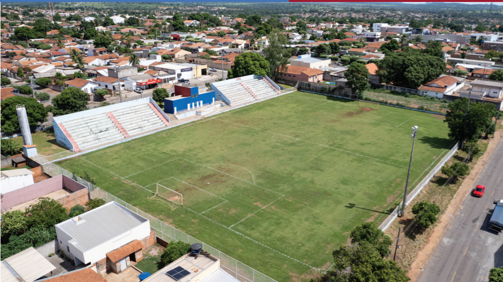
REFORMA DO MINI ESTÁDIO PINHEIRÃO