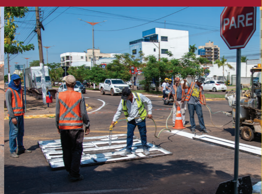
SINALIZAÇÃO HORIZONTAL E VERTICAL