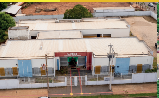
CONTRUÇÃO CMEI PROF. GERALDO JOSÉ DE OLIVEIRA - JD. BELA VISTA