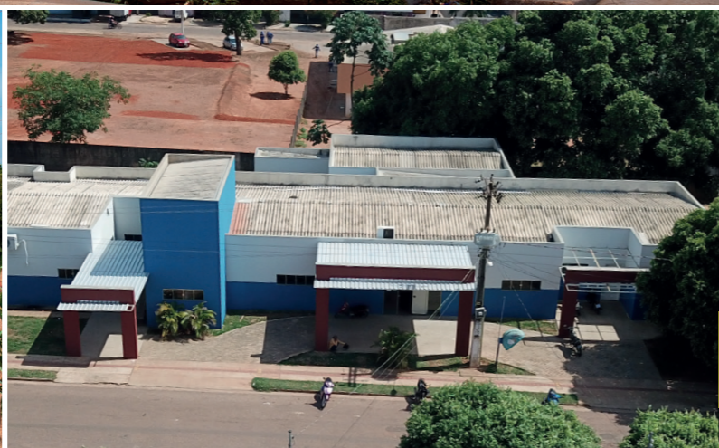
REFORMA DA POLICLÍNICA PADRE LOTHAR - VILA ITAMARATY