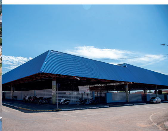
REFORMA DA FEIRA DA VILA OPERÁRIA

VILA OPERÁRIA, VILA MARIANA E VILA ITAMARATY