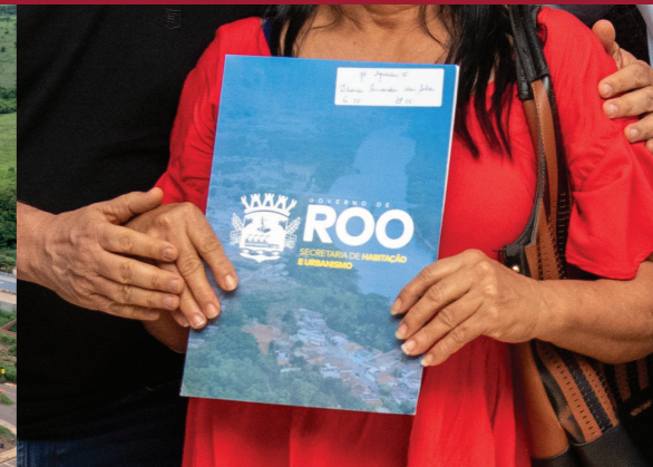
ENTREGA DE ESCRITURAS EM DIVERSOS BAIRROS