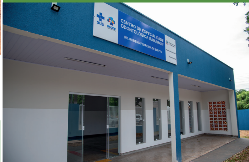
IMPLANTAÇÃO DO CENTRO DE ESPECIALIDADES EM ODONTOLOGIA VILA ITAMARATY