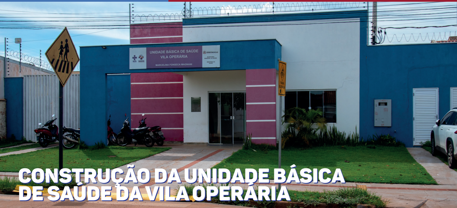
CONSTRUÇÃO DA UNIDADE BÁSICA DE SAÚDE DA VILA OPERÁRIA