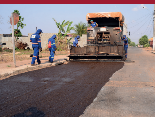
100% DE ASFALTO E APLICAÇÃO DE MICRORREVESTIMENTO EM TODA REGIÃO