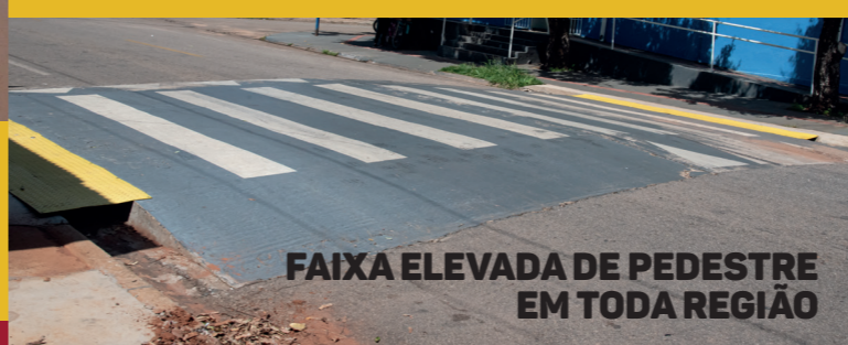
FAIXA ELEVADA DE PEDESTRE EM TODA REGIÃO