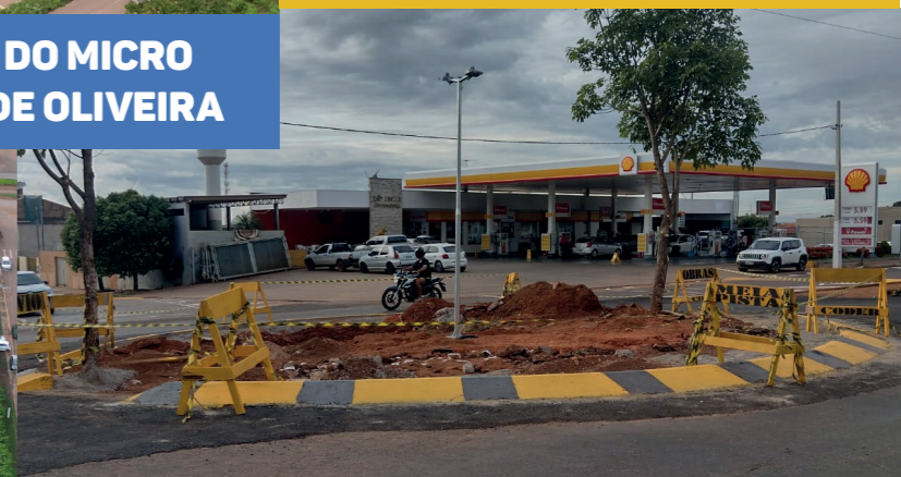
CONSTRUÇÃO DE ROTATÓRIA NA AVENIDA BANDEIRANTES LIGANDO A RUA FILINTO MULLER