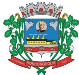
TABELA DE TEMPORALIDADE E DESTINAÇÃO DE DOCUMENTOS DA SECRETARIA MUNICIPAL DE HABITAÇÃO E URBANISMO