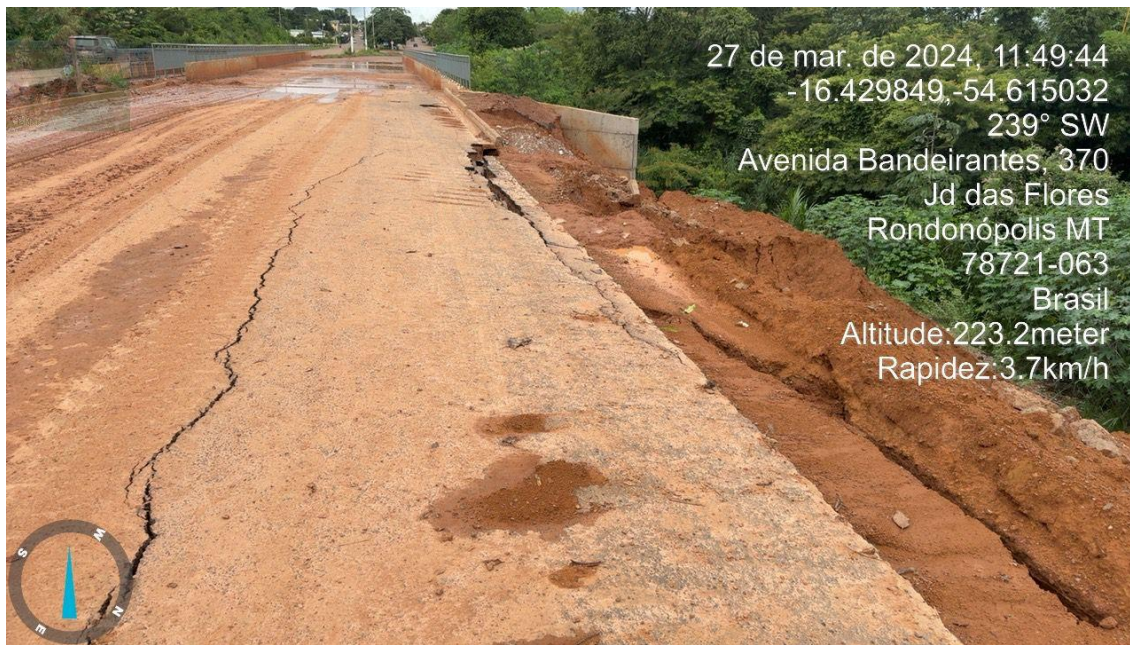
Foto 01 –Fissuras no Pavimento/aterro da nova pista da Duplicação da Av. Bandeirantes.