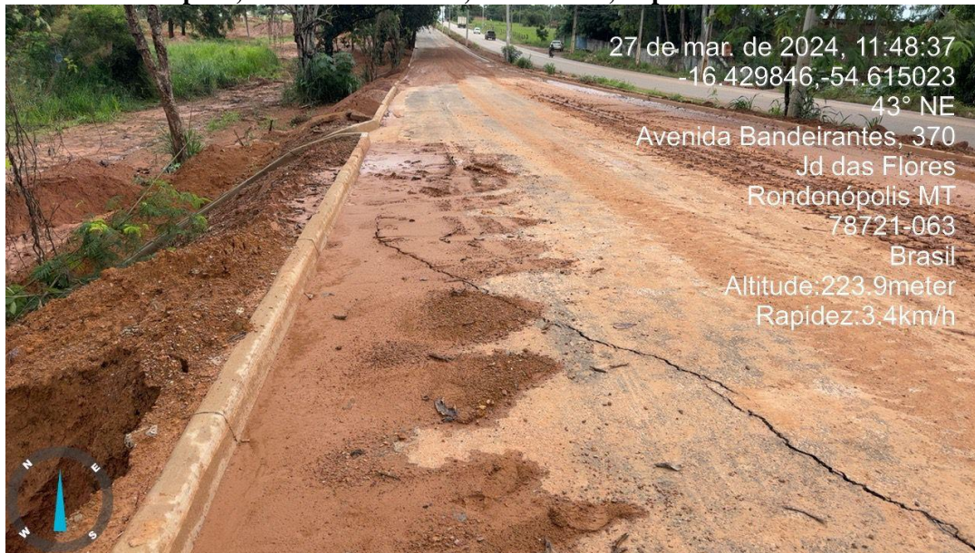
Foto 03 -Fissuras no Pavimento nova Duplicação da Av. Bandeirantes.